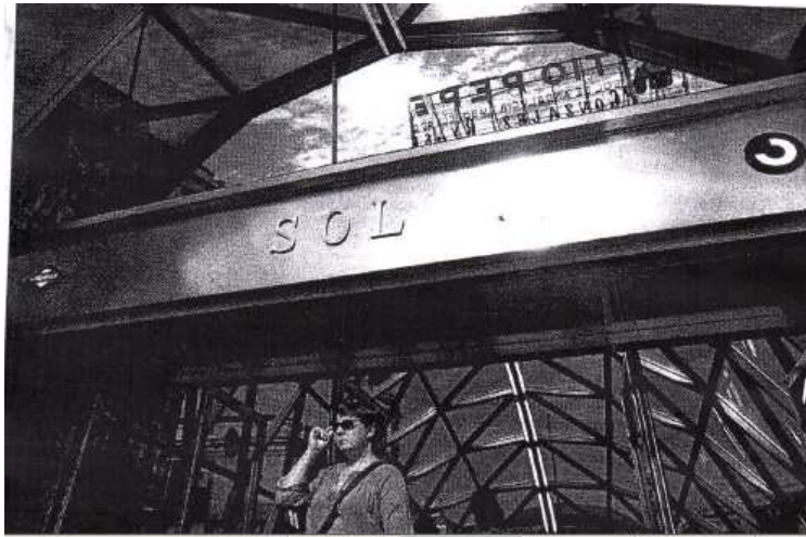
Amparo Valcarce se fotografía en la Puerta del Sol en 2009