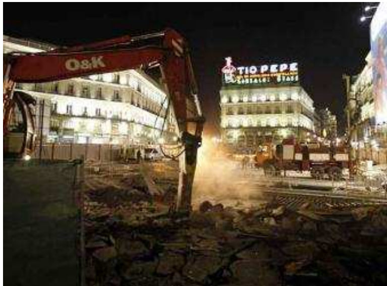
Durante 5 años así ha estado la Puerta del Sol de Madrid